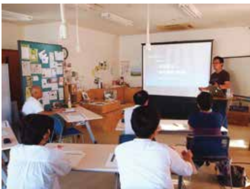
創業塾 東御市商工会館にて