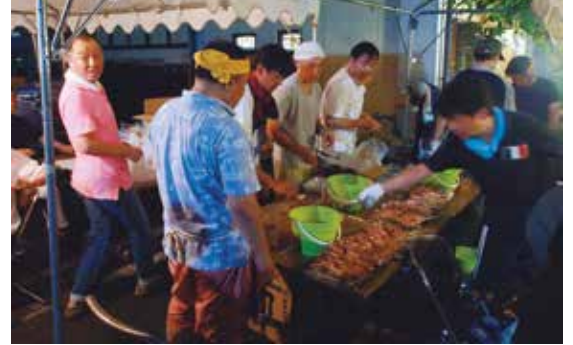
花市 8月 田中商店街にて