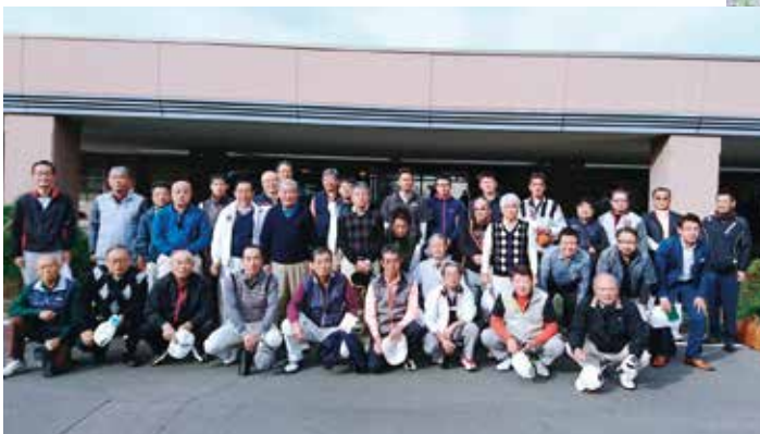
商工会ゴルフコンペ 浅間高原カントリー倶楽部