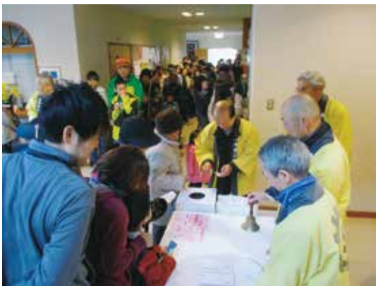
えびす講 11月 田中公民館にて