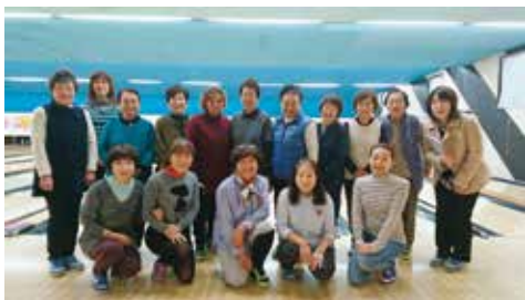
恒例のボーリング大会