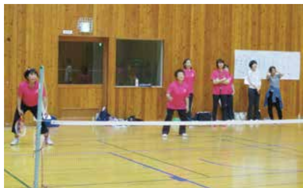
東御市女性部 上小スポーツ大会