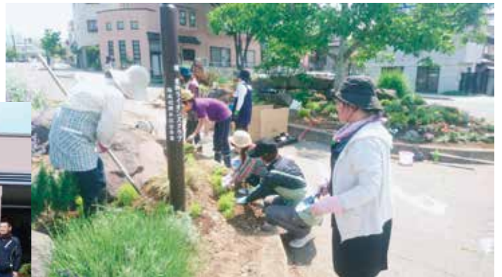
商店街女性の会 花壇整備