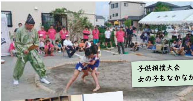
子供相撲大会 女の子もなかなか