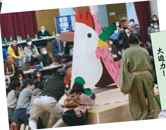
どんどこ！ 巨大紙相撲大会 大迫力！