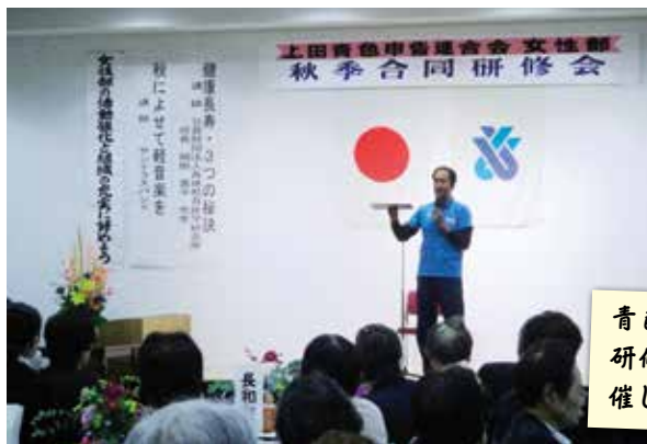
青色申告会女性部 研修会を東御で開 催しました