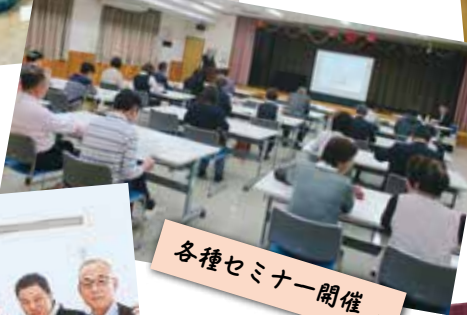
各種セミナー開催