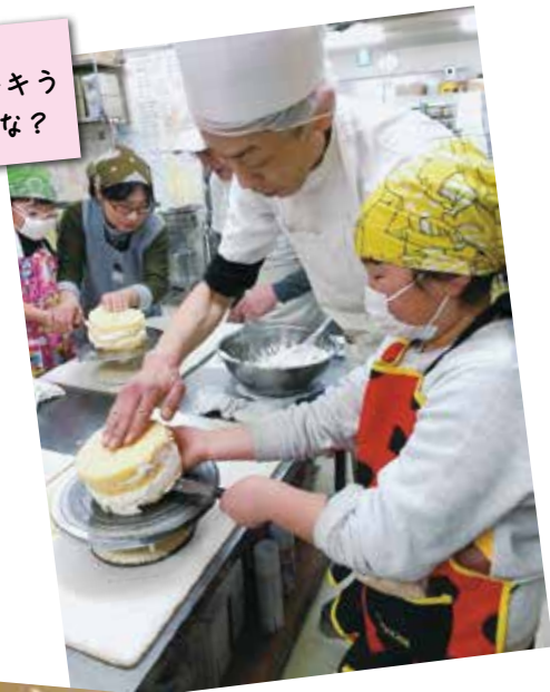
まちゼミ 初めてのケーキう まくできたかな？