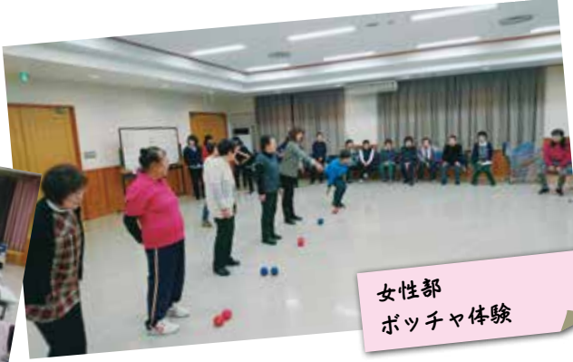
女性部 ボッチャ体験