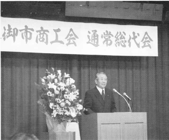
▲あいさつする柳橋商工会長