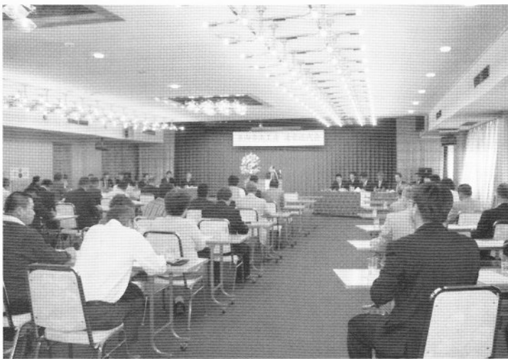
▲多数の総代が出席