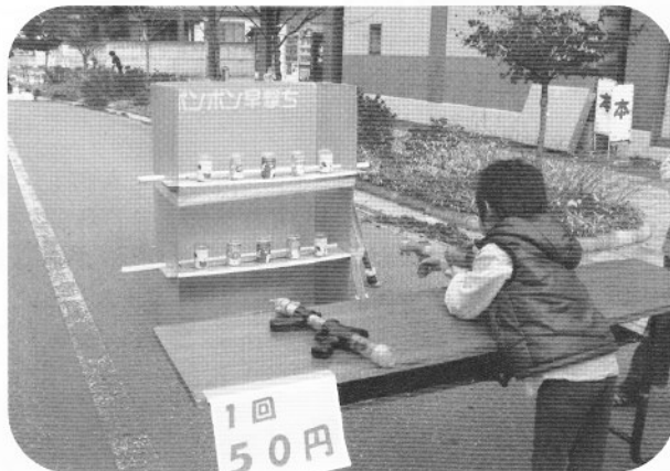
▲お楽しみゲーム「ボンボン早撃ち」