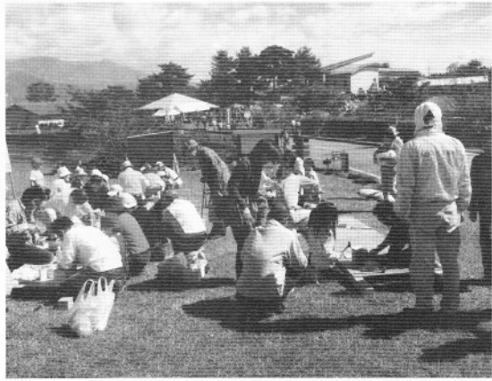
▲ファンシーボックス制作会場

古代から東御市北御牧地区では製陶が盛んに行われ、それを裏付けるように平安時代につくられた瓦や須恵器が多く出土し、その登り窯跡も多数確認されています。この様な歴史の里「芸術むら公園」において、市民を中心とした作品を登り窯で焼成しながら、芸術・文化にふれあい、楽しみ、学ぶことを目的として10月10日(土)・11日(日)に約3万人の来場者のもと「火のアートフェスティバル2009」を開催しました。商工会でも女性部・北御牧支会・みまきスタンプ会・東御市建設業協会の皆さんが参加し、うどん・