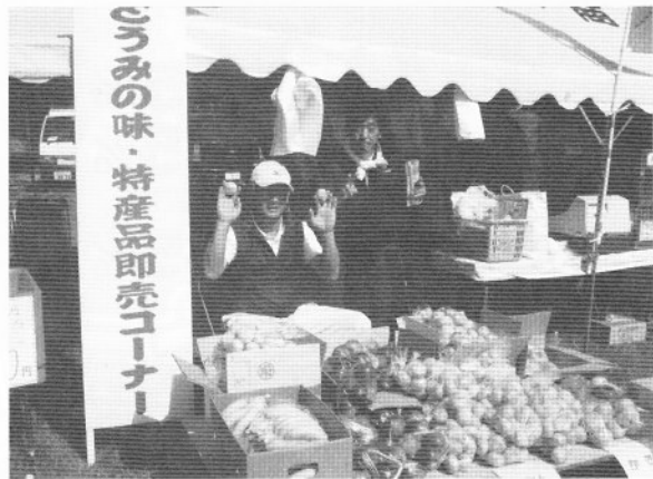
▲特産品等即売コーナー

古代から東御市北御牧地区では製陶が盛んに行われ、それを裏付けるように平安時代につくられた瓦や須恵器が多く出土し、その登り窯跡も多数確認されています。この様な歴史の里「芸術むら公園」において、市民を中心とした作品を登り窯で焼成しながら、芸術・文化にふれあい、楽しみ、学ぶことを目的として10月10日(土)・11日(日)に約3万人の来場者のもと「火のアートフェスティバル2009」を開催しました。商工会でも女性部・北御牧支会・みまきスタンプ会・東御市建設業協会の皆さんが参加し、うどん・