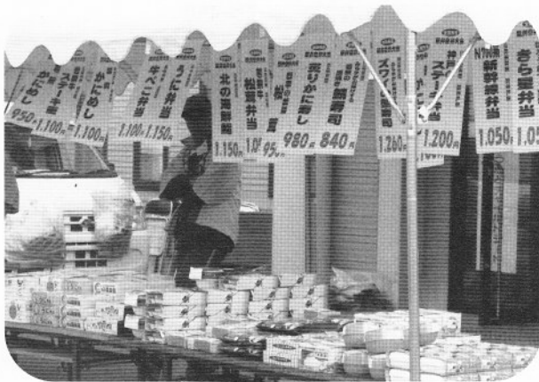
▲全国有名駅弁・空弁販売会場

当日は、「もちつき大会」・「お楽しみゲーム」・「包丁研ぎ」・「くるみおはぎ・うどんの販売」・「バザー」・「惣菜・海産物・フルーツ等の販売」・「全国有名駅弁・空弁まつり」・「大抽選会」等盛りだくさんの催しが行われ大勢の来客で賑わいました。